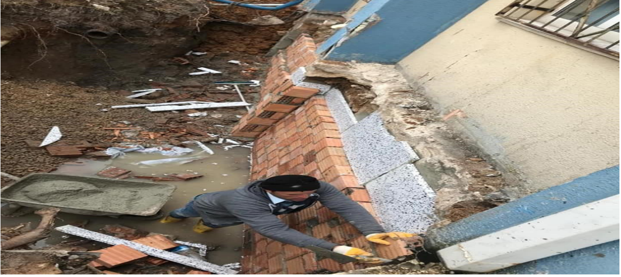
Kayalı Kampüsü Dere İstinat Duvarı